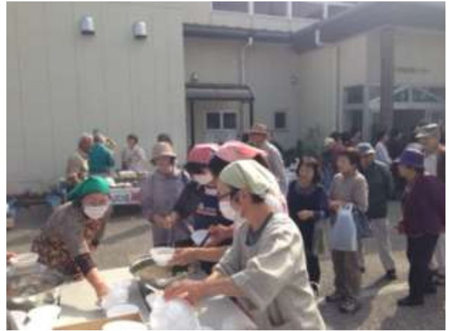
いも煮に並ぶ来場者