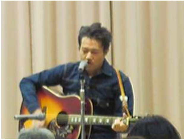
龍美勇一さんライブコンサート

ホールでは、プロミュージシャン龍美勇一氏による、なつかしい50年代のカントリーからロックなどギターによるライブコンサートが行われました。